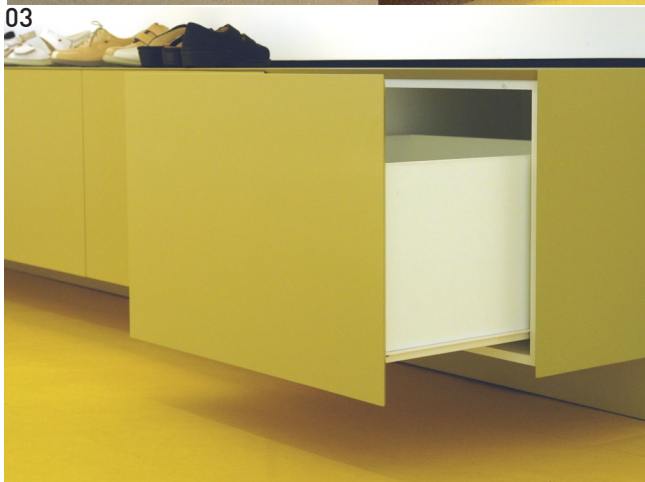
01 grundriss 02 ansicht des verkaufbereichs 03 detailansicht